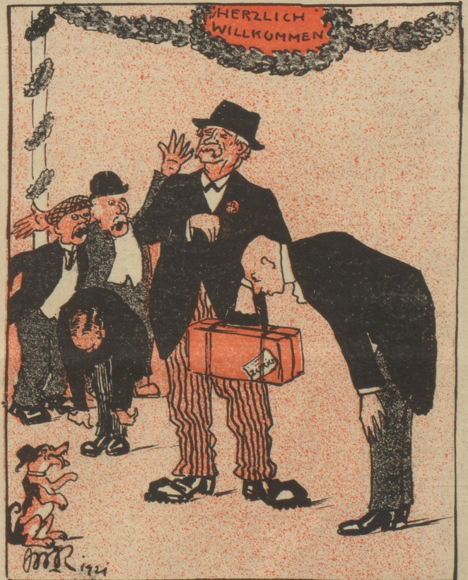
Drum lob' den Schweizer Frank' ich, ohne Spaß, Er gilt doch in der Welt noch 'was: Sein Klang erschließt tausend Pforten Und macht willkommen aller Orten!