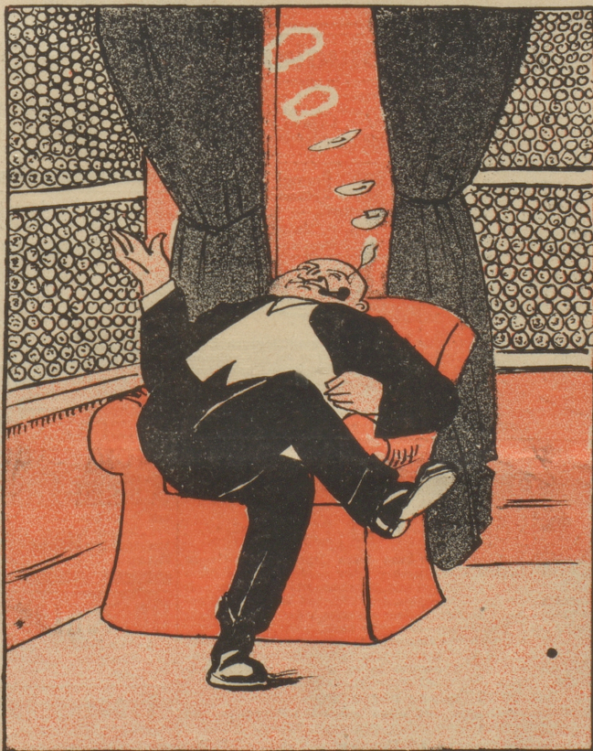
Die Tschecho-Slowakei mit Glasgeld es probiert, Vielleicht der Dollar-Kabob Fenster 'mit garniert.