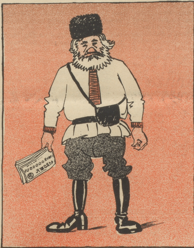
Hier steht ein Gornet-Kubel-Milliardär. In seiner Barfschaft zwar trägt er nicht schwer!

(Nach dem Meißener Porzellangeld taucht nun in der Tschechoslowakei der Gedanke eines gläsernen Geldes auf.)