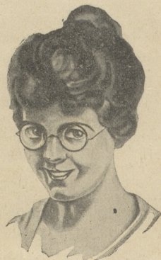
Die Brille dem Geschmack zur Wahl, Als Brillenglas nur Zeiss Punktal!