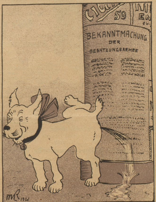
Wegen Verhöhnung und ungebührlichen Benehmens durch den Hund Bobbi, verfaßt an einer Bekanntmachung der Okkupationsarmee.