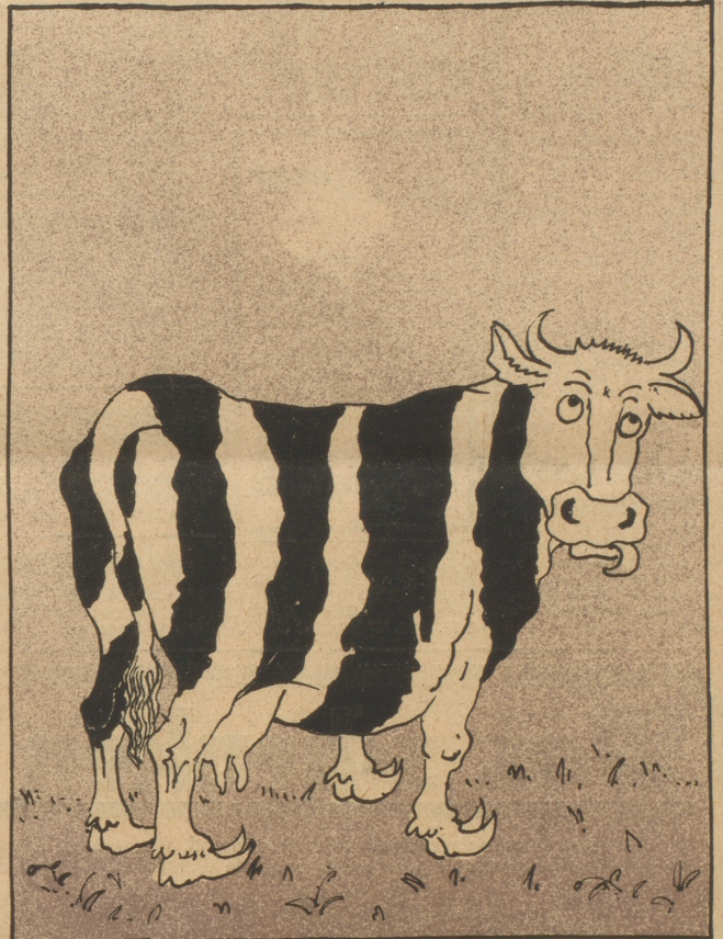
Wegen passiven Widerstandes und böswilliger Herausforderung durch Lieferung einer Kuh an die Wiedergutmachungsbehörde, welche nicht das garantierte Quantum Milch gibt und außerdem durch ihr schwarz-weißes Fell unangenehm auffällt; man vermutet, die Kuh sei „deutsch-national“ oder preußisch orientiert.