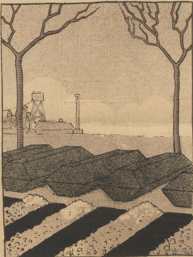
Wegen böswilligen Nichterfüllens des Kohlenabkommens, da die Produktion der Grube Wendel bei Sorbach eingestellt ist, infolge einer Explosion, wobei 11 Bergleute tot und 150 verchüttet wurden.

(Wie wir aus zuverlässiger Quelle vernehmen, soll die Entente eine neue Note mit der Androhung der Besetzung weiteren deutschen Gebietes und anderer Zwangsmaßnahmen an Deutschland gerichtet haben, wegen erneuter Verletzungen des Versailler Vertrages.)