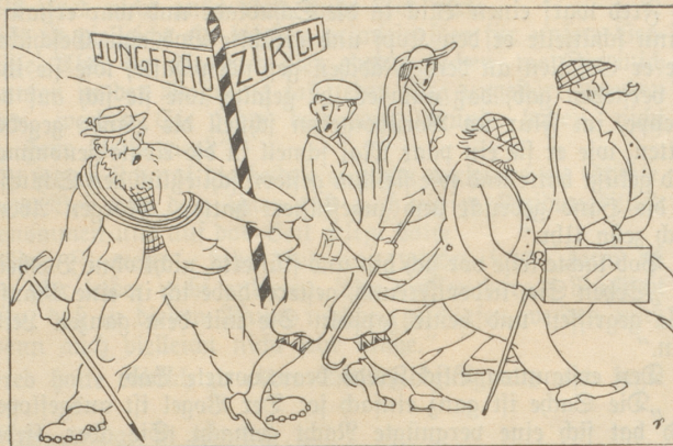
Der Führer erfüllt mit Gewalt seine Pflicht. Die Herrschaften aber gehorchen ihm nicht. Sie fühlten sich einfach nach Zürich gedrängt, wo im Wolfsberg die englische Graphik hängt.

„Dieses Mädchen tut sich dadurch hervor, daß es sich immer die allerschlechteste und niedrigste Gesellschaft ausucht. Den