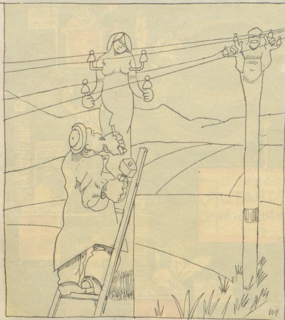
Die Holzbildhauer erhalten den Auftrag, die Telegraphenstangen künstlerisch zu gestalten