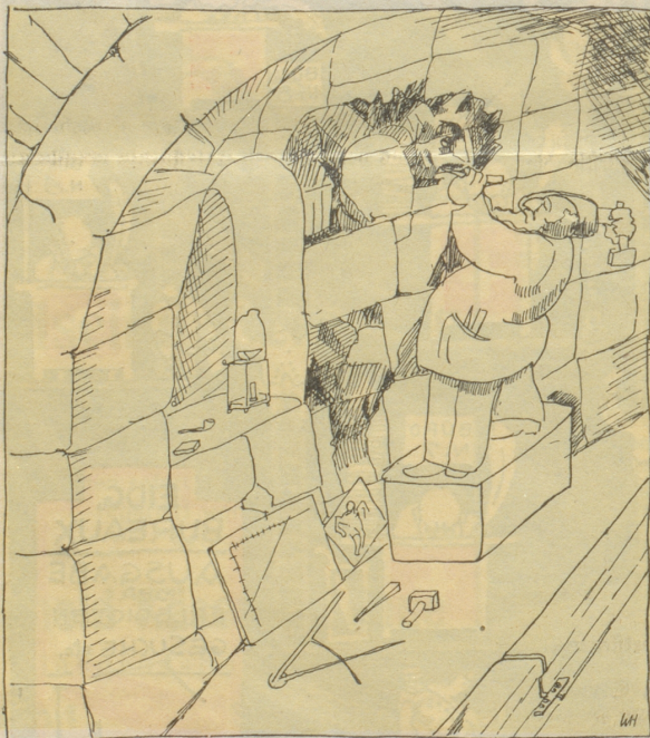
Die Bildhauer übernehmen die künstlerische Ausschmückung der Eisenbahntunnels