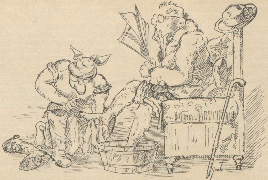
„Zu was es Familiebad? Das mached mir diheim.“

Adressen der Frau von Markaß und des Hotelportiers.