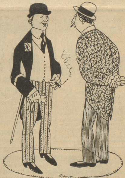
„Sit wann rauchsch du Du; ich ha g'meint, Du bisch Nichtraucher?!“ — „Sit ich d' „Sabanero Weber“ künne glernt ha, nümme!“

Auf den warmen, sonnigen Frühlingstag war ein linder Abend gefolgt. Der Frühling hatte über den Winter gesiegt. Die ersten grünen Blattspitzen wagten sich allenthalben hervor. Ein gelbgrüner Schleier schien über den Tiergarten gebreitet zu sein. Auf den