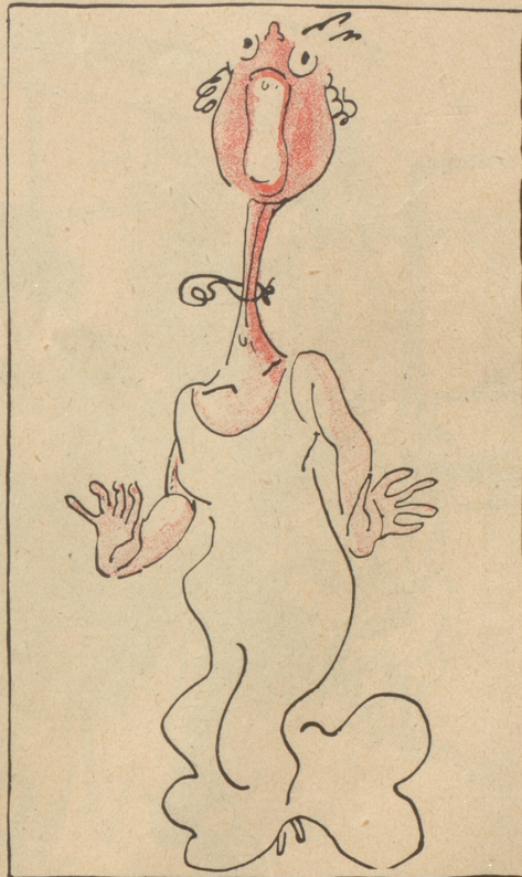
den Hals aus

Er schüttelte den Kopf und lächelte verschmizt. „Ich denke nicht daran, lieber Herr Cureidi, ich bin tatsächlich Steuerhund, d. h. ich bin von der Steuerbehörde als Hund angestellt.“