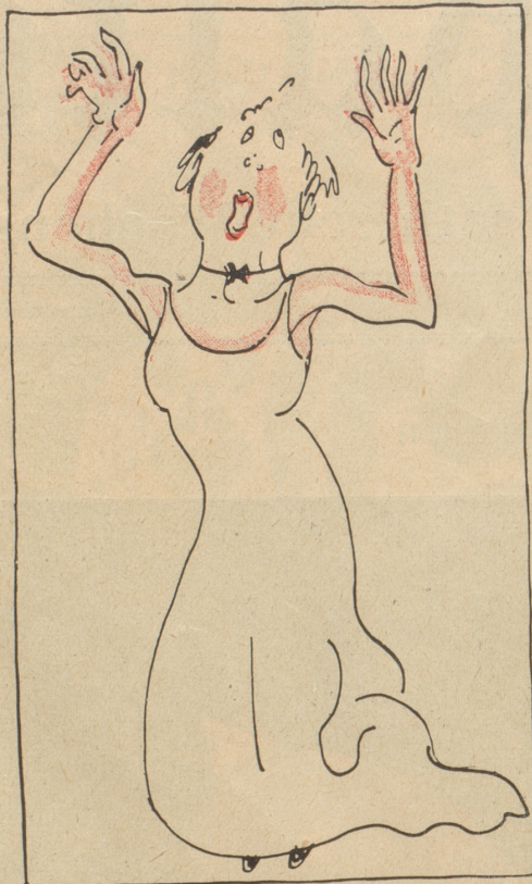
Fräulein Bethli Towäger