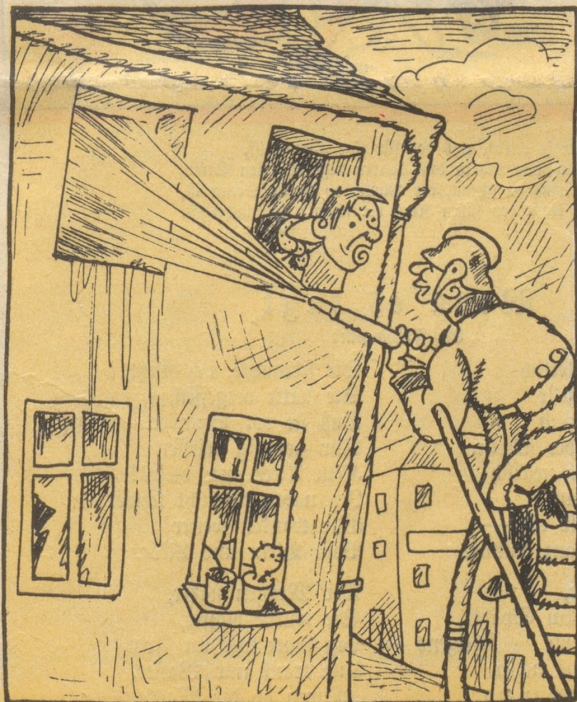
„Heda! es isch ja scho lang glöschet gfi, bis Ihr cho sind!“ „Me häd eus grüest und jekt wird gschprüzt!“