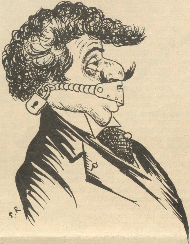
Der italienische Tenor während seiner Schweizer-Tournee mit einer speziellen Vorrichtung gegen die Beschagnahme seiner Stimme durch die Zürcher Behörde.

(In der leidlich peinlichen Affäre Stamm-Toscanini [Scala-Orchester] wurden den italienischen Musikern, die durch die Nachenschaften Stamms schon genügend geschädigt waren, von Zürcher Behörden auch noch die Instrumente mit Beschlag belegt.) Rabinovitch