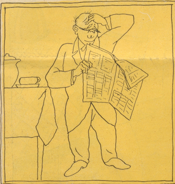
„Oh! Ich bin ruiniert! Nicht mehr gewählt! Wo treib ich das viele Geld für das Geschäftsporto auf!“