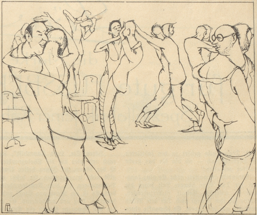
Sie verbindet das Zürchergemüt mit dem Berner Temperament.

„Die Stunde, da das Gold seinen Wert verliert. Die Stunde, da die Barren in unserem Keller nicht viel mehr wert sind, als der Dünghaufen dort draußen im Garten . . . Begreifen Sie denn nicht, daß es im Augenblick eine Maschine gibt, die Sovereigns über die Welt speit. Daß vielleicht irgendein Genie umhergeht, das Gold fabriziert, ebensoleicht wie Ihre Frau einen Plumpudding herstellt.“