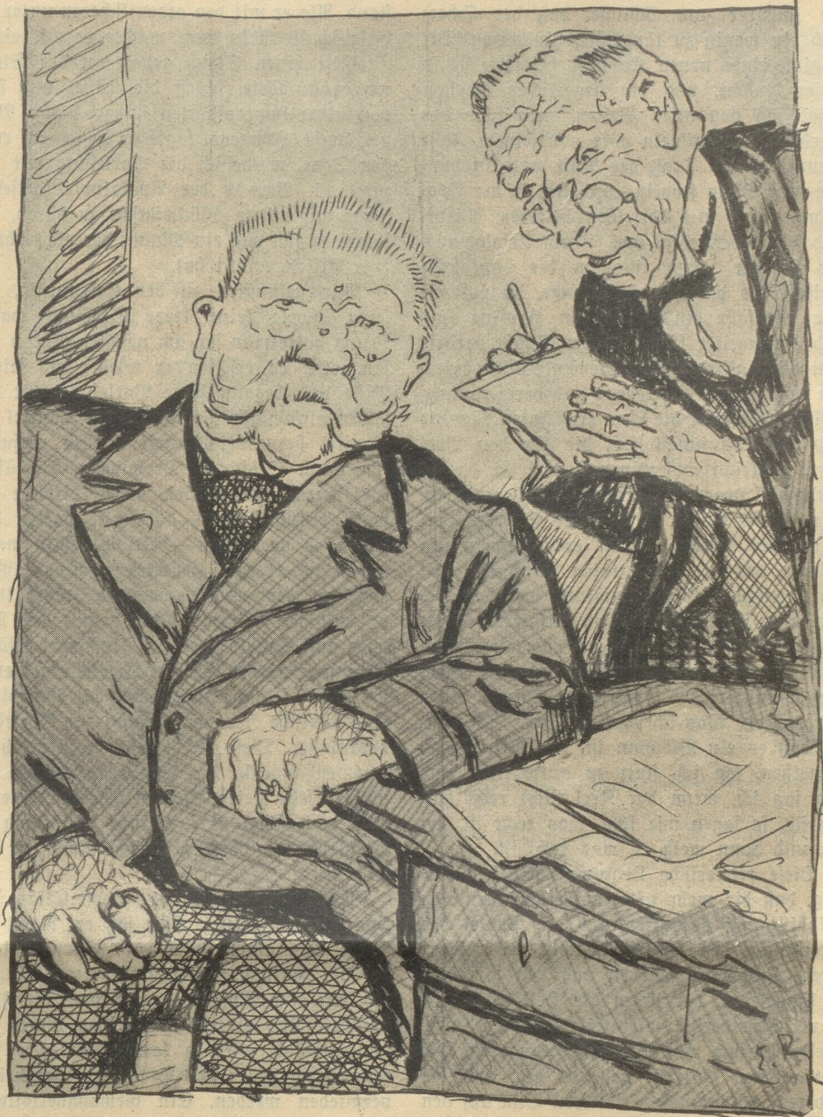
„Und wen halten der Herr Präsident als den gefährlichsten Feind von Deutschlands Zukunft?“ „Seine Ueberpatrioten.“

Bei dieser Erscheinung brach man auf allen Seiten in Gelächter und Beifallsklat-