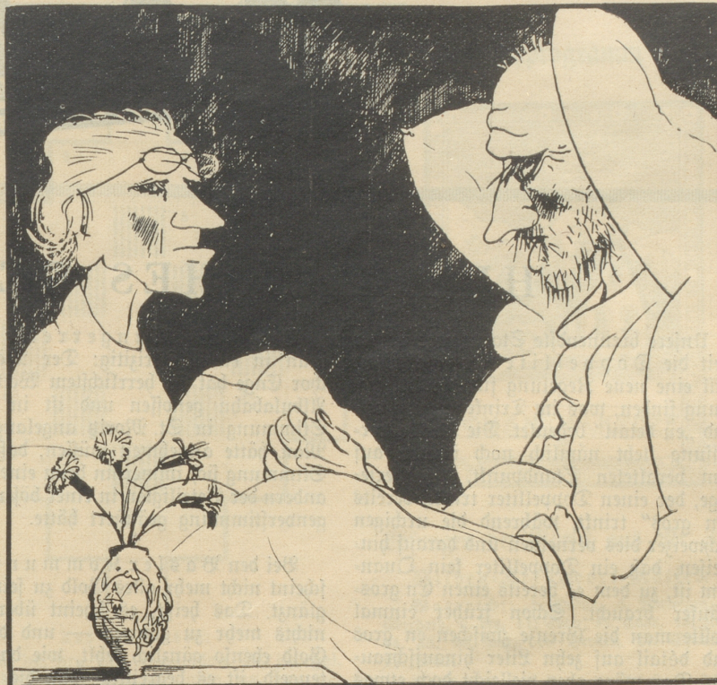
„Jetzt kann ich wenigstens ruhig sterben, wenn die Schweiz wieder die Weltmeisterschaft im Gewehrschießen hat.“

Ihr Narren, brummte ein anderer, haben wir nicht einen Mann, der drei Pfarrer aufwiegt und mit Textsprüchen um sich schmeißt, wie mit Dreck, wenn einer Gold gräbt? Was wollt ihr noch mehr?