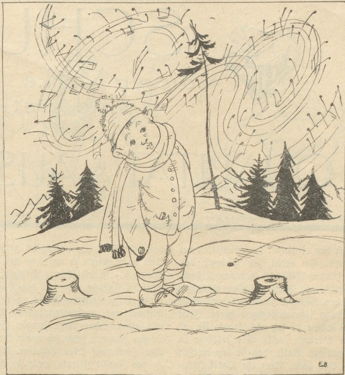
„Jetzt weiß i nöb, singt da 's Christkindli oder ischt ame-ne Det en Lutschprecher verborge!“

Vor zwei Jahren, als Palmer auf dem weißen Strande der Matelotas-Laguna landete, um sich als Schildpatt Händler niederzulassen, war Tinaban einer der drei Häuptlinge, die diesen palmenbewachsenen Archipel mit unbeschränkter Machtoollkommenheit beherrschten. Die beiden anderen waren seine Halbbrüder, Zelik und Rao. Alle drei begrüßten den weißen Mann bei seiner Landung und tauschten nach der Sitte des Volkes von Las Matelotas Geschenke und Freundschaftsbeteuerungen mit ihm aus. Als aber Palmer sich dafür entschied, sein Haus und seine Handelsstation in dem von Zelik beherrschten Dorfe zu erbauen, fühlte sich Tinaban auf das bitterste gekränkt. Seit langer Zeit schon strebte er danach, einen weißen Händler für sein eigenes Dorf zu gewinnen. Scharfe Worte wurden zwischen ihm und seinen Brüdern gewechselt. Palmer stand dabei und sagte nichts. Er hatte eine instinktmäßige Abneigung gegen Tinaban. Daß dieser Häuptling in dem Rufe eines grausamen und blutdürstigen Tyrannen stand, hatte der Händler schon gehört, ehe er nach den Karolinen ge-