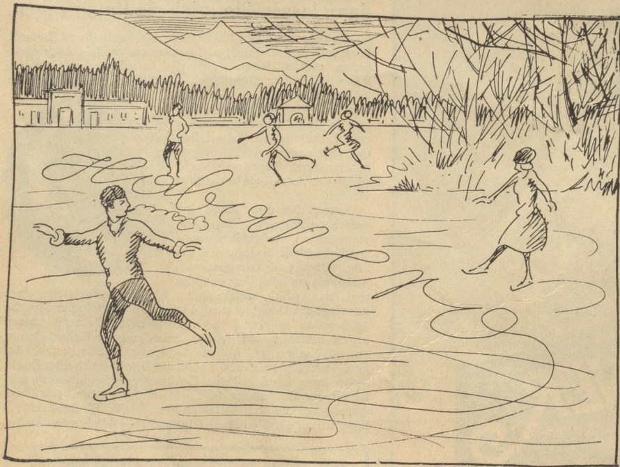
Der Habanero-Raucher als Eiskünstler.