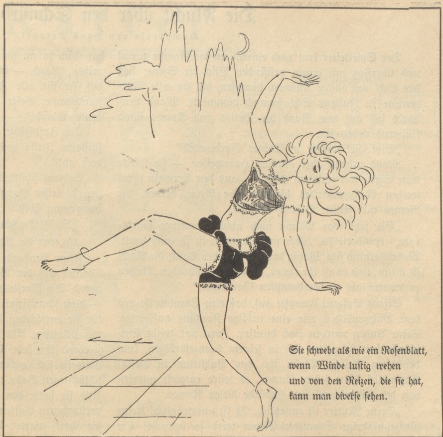
Sie schwebt als wie ein Rosenblatt, wenn Winde lustig wehen und von den Reizen, die sie hat, kann man direkt sehen.

„Sie sind Jonas Fjeld?“ sagte er bewegt. „Das ist der Name des Mannes, der stets in der Erinnerung aller guten englischen