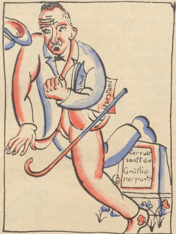
Herr Ribi denkt: „Er ist doch mein“. Schon stolpert er an einem Stein.