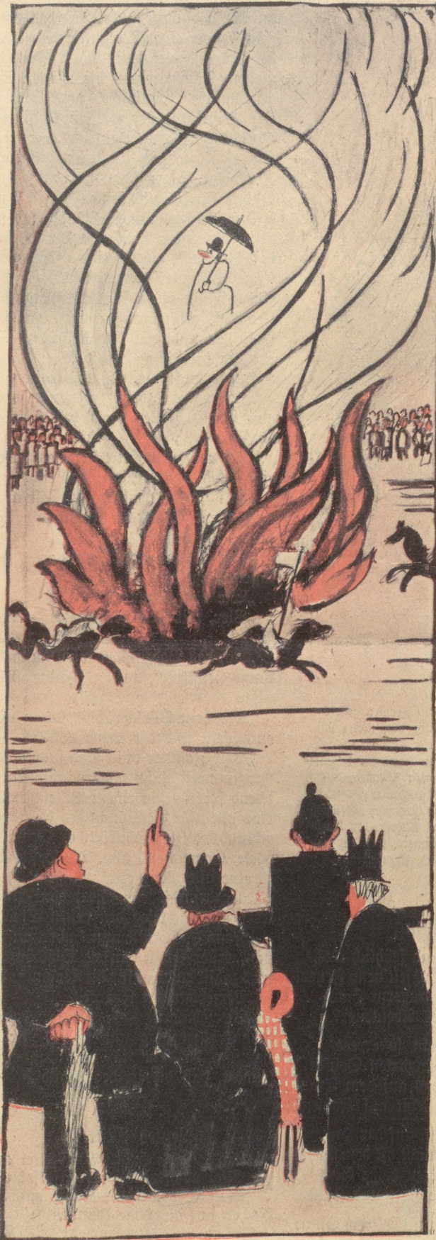
„Das isch jeh der feusebrüßgisch Bögg, wo-n-ich gseh bränne. Es isch doch öppis chaibe schönes, e so nes Füt.“