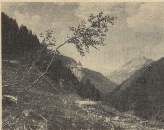
Blick auf Val Sinestra