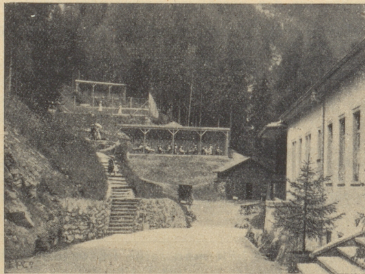
Sonnenkuren in den Liegehallen im Kurhaus Val Sinestra