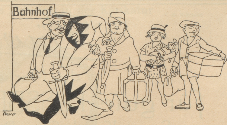
„Der Nebelspalter muß mit in die Ferien!“

Im Kanton Baselstadt findet am 26./27. Juni eine Volksabstimmung statt über ein Initiativbegehren betreffend den Bau von Wohnungen durch die Einwohnergemeinde der Stadt und betreffend Unterstützung ge-