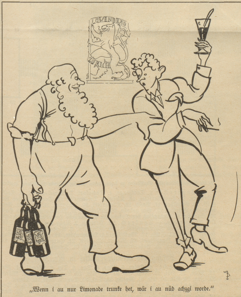
„Wenn i au nur Limonade trunke het, wär i au nid achgi worde.“

In der landwirtschaftlichen Beilage einer unserer führenden Zeitungen wird Propaganda gemacht für den Bernhardinerhund, der dabei als unser „Nationalhund“ bezeichnet wird. Allerdings hat er in diesem Ehrenamt noch Konkurrenten, den Sennenhund, der als „zweiter Nationalhund“ bezeichnet wird. — Nun kann es ja nicht mehr fehlen! Wenn zu all den nationalen Errungenschaften, die wir schon haben, auch noch