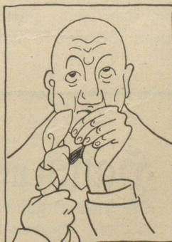
Donnerwetter, - was wollt ich denn nur? ---