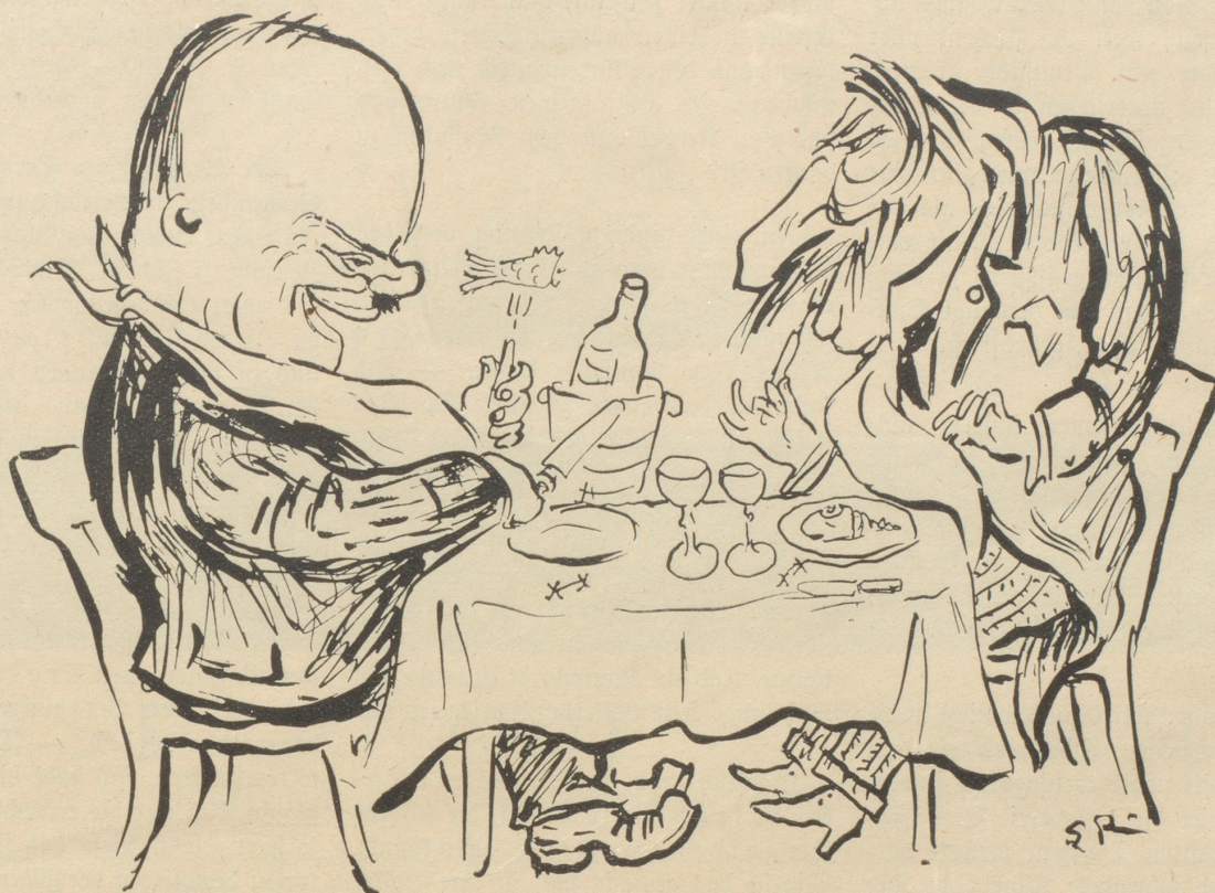
„Die Liebe geht durch den Magen“

für das große Unternehmen gründlich vorbereitet.“ So las man in der Zeitung über Gertrud Ederle. Merkwürdig ist nur, daß andere Mütter noch weit mehr als zwei Kinder gestillt haben und trotzdem nicht einen Meter weit schwimmen kön-