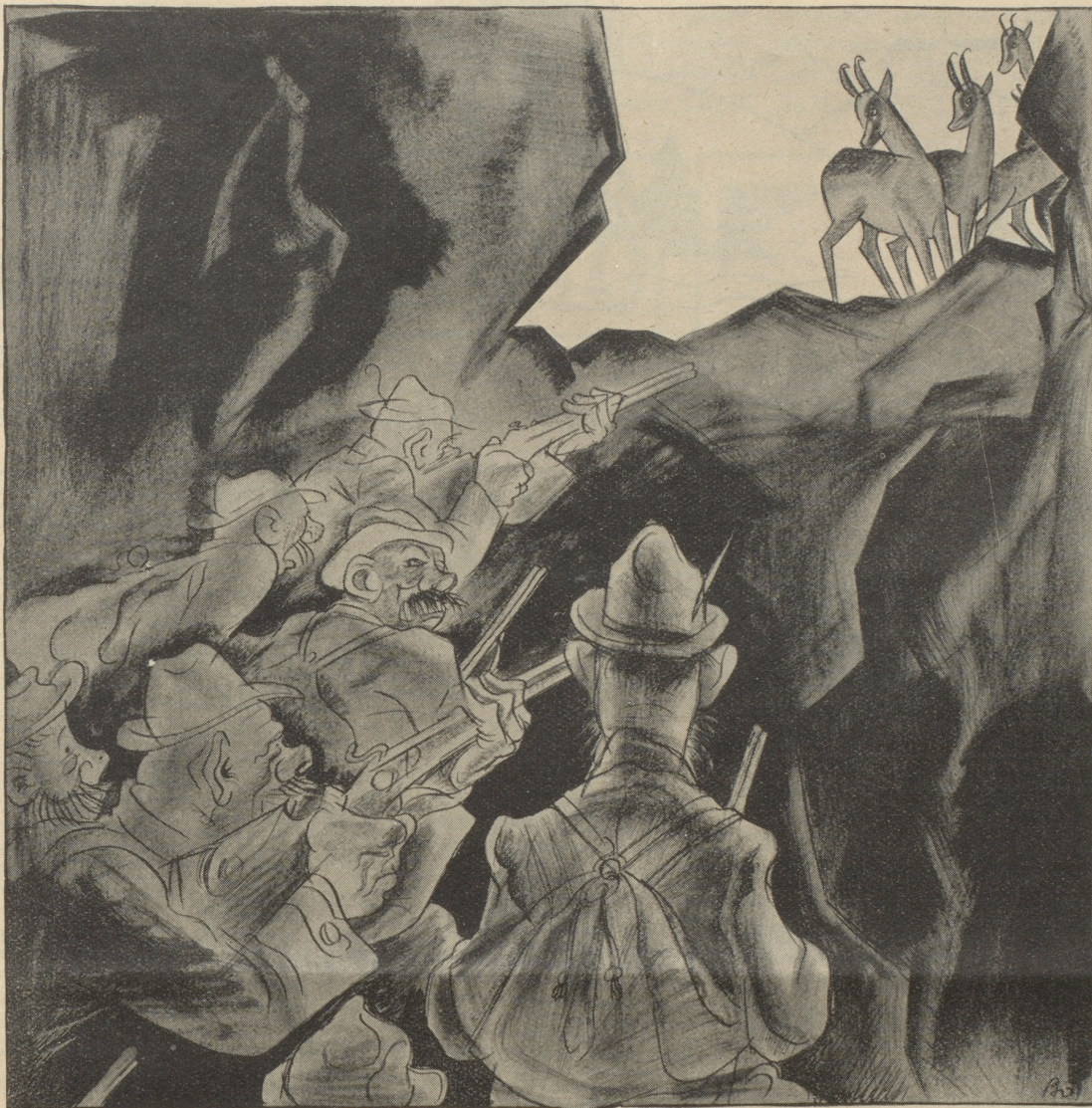
Das Leittier: Keine Angst, Kinder, das können unmöglich Jäger sein.