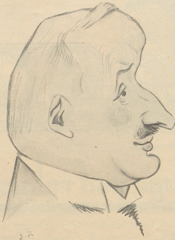
Vizepräsident des Bundesrates Giuseppe Motta