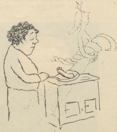
Bekanntlich ist Letztere, wie alle Damen, launenhaft: Es folgten magere Zeiten.