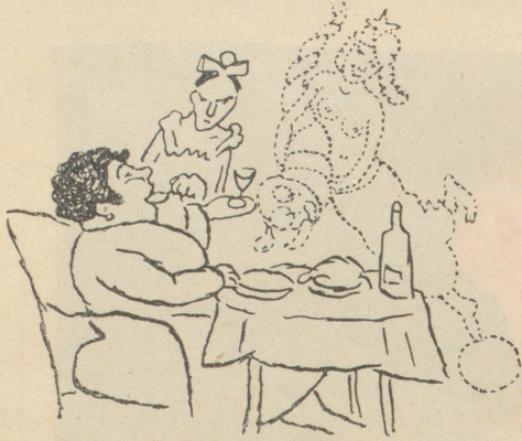
Einer Dame lächelte gnädigst Fortuna.