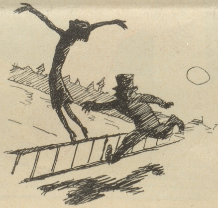
„Halt ein, welche ideale moderne Silhouette!“ schrie ein Kinoregisseur, der Zeuge dieses Verzweiflungsaktes war.