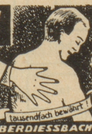
PHOTO - OPTIK