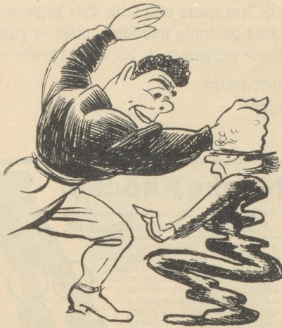
So... nur eine kleine Einschüchterung.