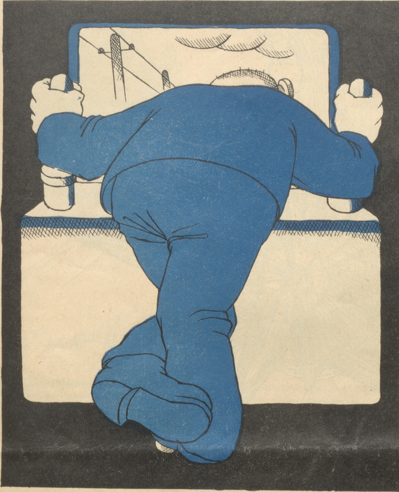
Das Einmann- und das W.C.-Problem.

ten. Diesmal gelang der Einsatz und die Sache gedieh zu gutem Ende. Eigentlich war die Zeit reichlich knapp nach Schluß der Probe, wenn man sich für das Konzert festlich herrichten wollte, aber jetzt eben erhob die Sängerin ihre Stimme, und es klang wie liebliches Kinderlachen und Engeljauchzen durch den Saal; man mußte immer und immer noch einmal lauschen. Sie sang und sang und lächelte dabei ein liebliches Kinderlächeln, und ihre blauen Augen spazierten rund im Saale herum und guckten geradewegs voll harmloser Freude in andächtig zu ihr erhobene, härtige Männergesichter. Dann war auch dies vorbei und jetzt blieb nichts anders mehr übrig, als schleunigst den häuslichen Penaten zuzueilen. Das taten sie denn auch alle und waren dabei seltsam erhoben, daß das keifende Schelten der Angetrauten zu Hause über zu spätes Heimkommen eindrucklos abprallte. Gescholten wurde noch viel und vieler Orts an jenem Abend, ein klein wenig zu Recht. War es nicht lächerlich und gänzlich nutzlos, die guten seidernen Socken anzuziehen, wie es Herr Müller tat? (Er stand in