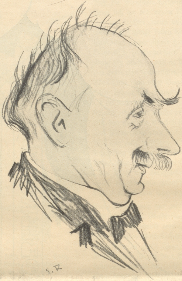
Nationalrat Otto Weber, St. Gallen

die kleine Frau zu besänftigen. „Aber sieh, ich habe heute Nacht gar nichts gemerkt...“ „Ja, weil sie an dich nicht gehen... weil du den ganzen Tag qualmt wie ein Schlot...“ „... nichts gemerkt,“ wiederholte Oskar, „sonst hätte ich natürlich schon dafür gesorgt, daß... Du weißt, ich bin patentierter — wollte sagen, experimentierter — Schnakenjäger und es entgeht mir so leicht keine! Aber jetzt muß ich gehen. Ich verspreche dir, daß du heute Abend nichts zu befürchten haben wirst.“ Er nahm seinen Hut. „Lege Salmiakkompressen auf's Gesicht, das mindert die Geschwulst... Ho — Ruf! Adieu Kleine!“ Und fort war er, froh, der unbehaglichen Situation entronnen zu sein.