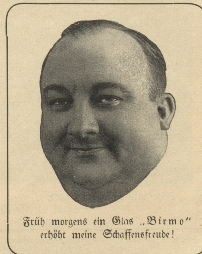
Früh morgens ein Glas „Birno“ erhöt meine Schaffensfreude!

Kapitän: „Wir fahren eben am Sternbild des Hundes vorbei.“