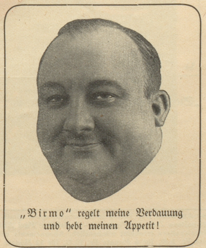
„Bir mo“ regelt meine Verdauung und hebt meinen Appetit!