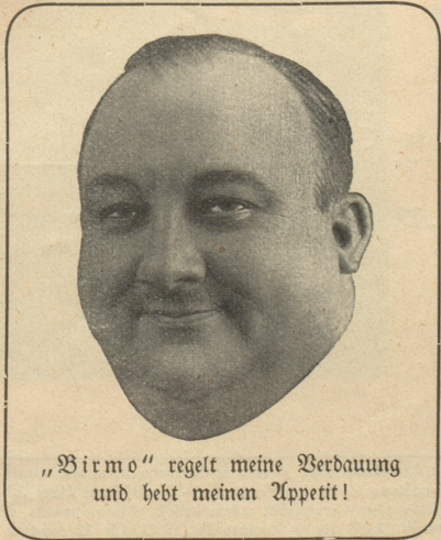
„Bir mo“ regelt meine Verdauung und hebt meinen Appetit!