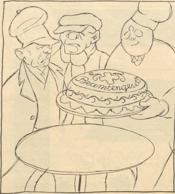
Der bürgerliche Zuckerbäcker setzt dem Sozi und dem Kommunisten eine schöne Torte vor.