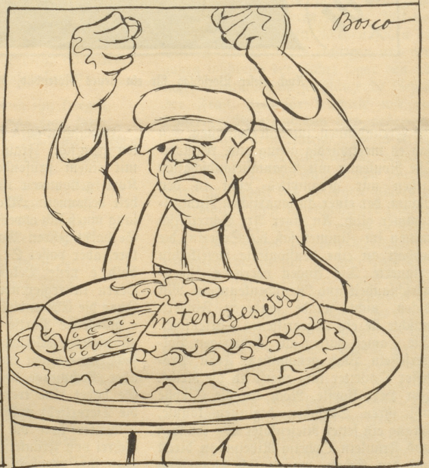
Hierauf packte den Kommunisten die Wut und er ergreift das Referendum, um die schöne Torte zu vernichten.