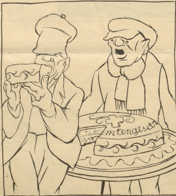
Nachdem er genügend geschimpft und geheßt hat, ißt er den Kuchen doch.