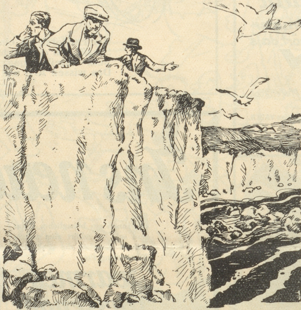
„Cyanea! Seht euch des Löwen Mähne an.“

„Also damit bin ich von dem Verdacht befreit,“ sagte Murdoch, sich langsam erhebend. „Ein paar Worte möchte ich noch zur Erklärung sagen, denn ich weiß, wohin Ihre Nachforschungen gegangen sind. Es ist wahr, ich liebte das Mädchen, aber von dem Tage an, an dem sie meinen Freund McPherson erwähnte, hatte ich mir noch den einen Wunsch, ihr zu ihrem Glück zu verhelfen. Ich war zufrieden damit, abseits zu stehen und als Vermittler zu handeln. Ich habe oft Bottschaften zwischen ihnen hin und her getragen, und weil ich ihr Vertrauen besaß, und sie mir so teuer war, eilte ich zu ihr, um ihr meines Freundes Tod mitzuteilen, bevor jemand mir in herzloser oder unvorsichtiger Art und Weise damit vorzukommen würde. Sie wollte Ihnen nichts von un-