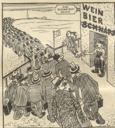
Der Bund sieht sich leider genötigt, die Fabrikation von gebrannten Wässern zu verbieten. Der Genuß von Schnaps wird überhaupt verboten. Angesichts dieses Zustandes wandern 100 000 Eidgenossen aus, halb so viel geht freiwillig in den Tod.