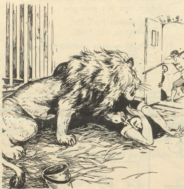
... Mit meinen Handsflächen versuchte ich das große, dampfende, blutbefleckte Maul von mir abzuwehren . . . .

Mensch erschlagen worden war. Als ich den Riegel zurückschob, sprang das Tier heraus und im Moment auf mich. Leonardo hätte mich retten können. Wenn er vorwärts gesprungen wäre und es mit seiner Keule geschlagen hätte, wäre es eingeschüchtert worden. Aber der Mann verlor seine Nerven. Ich hörte ihn vor Entsetzen laut schreien, dann sah ich ihn fehrtmachen und entfliehen. Im gleichen Moment gruben sich die Zähne des Löwen in mein Gesicht. Sein heißer widerlicher Atem hatte mir schon fast die Besinnung geraubt, so daß ich kaum die Schmerzen spürte. Mit meinen Handsflächen