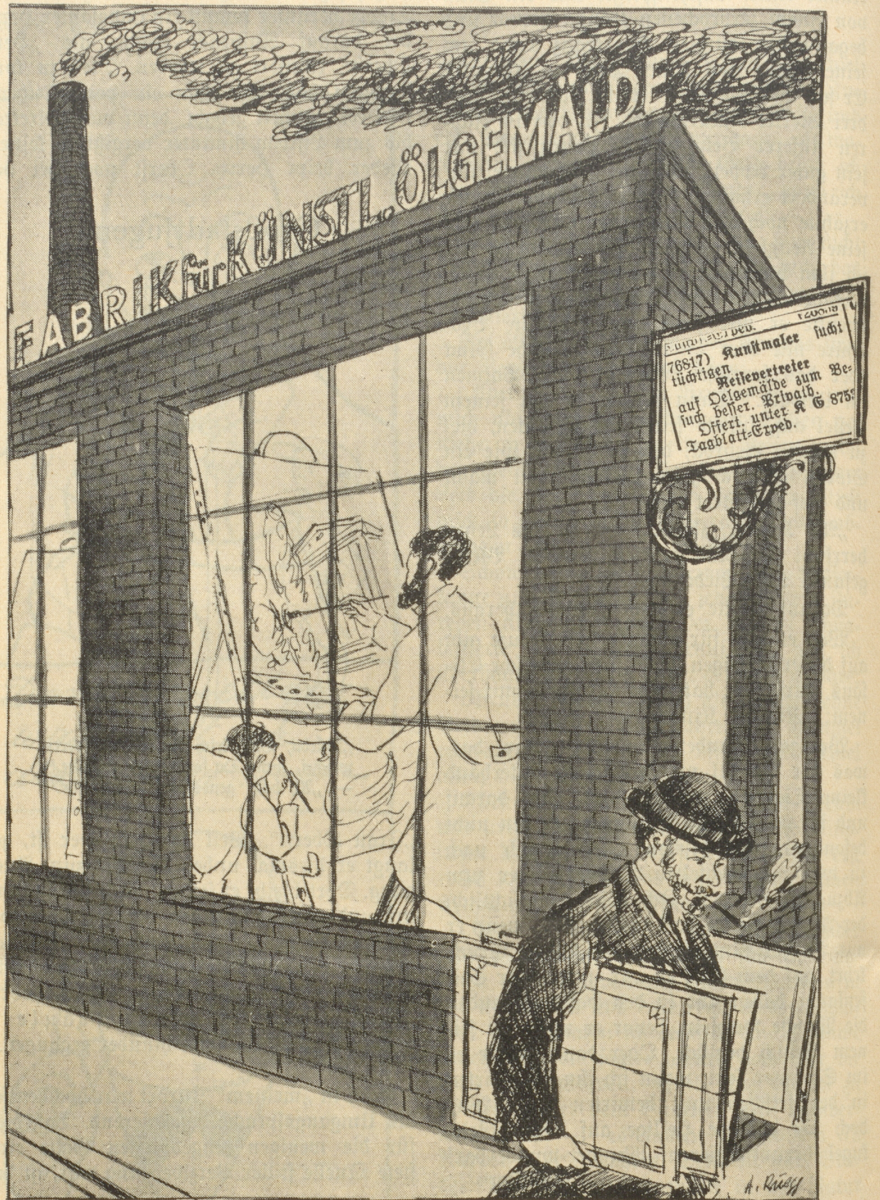
Nach zeitgemäßem Zeitungsinserat.