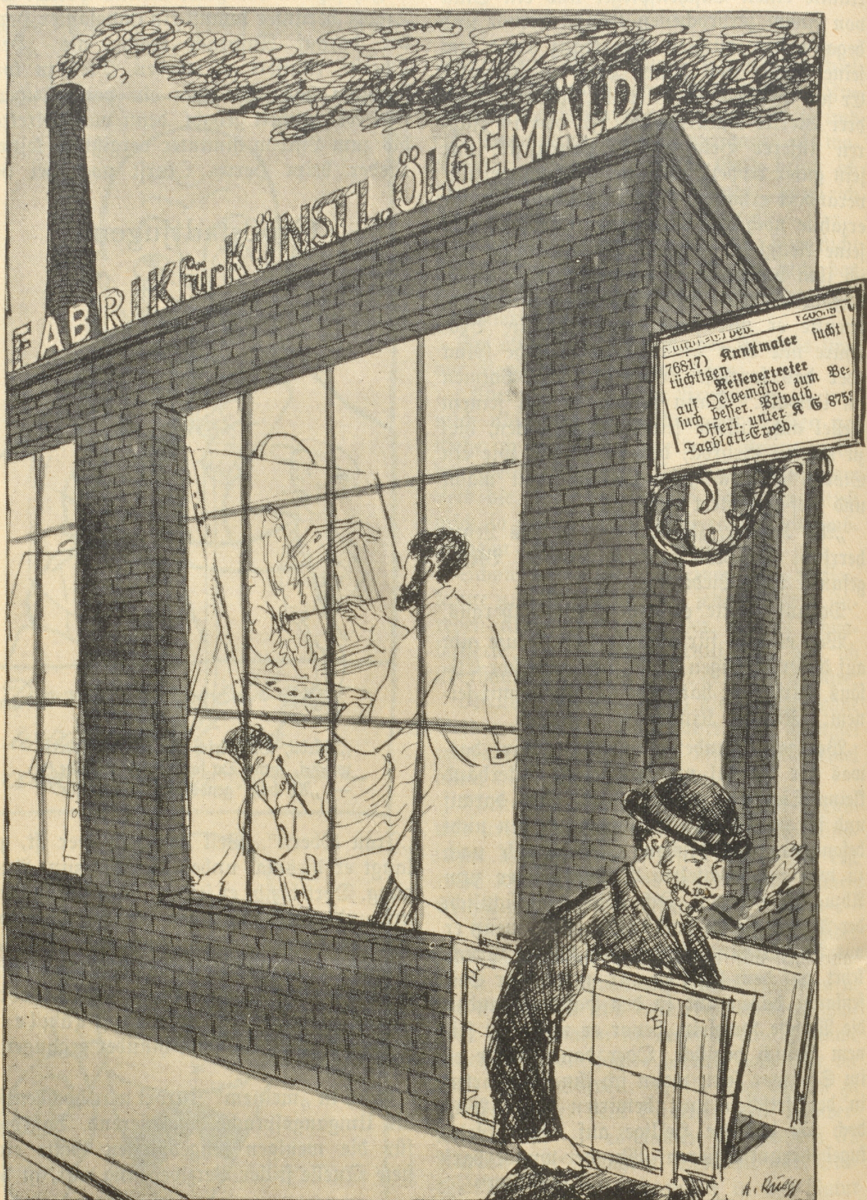
Nach zeitgemäßem Zeitungsinserat.