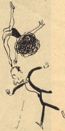
Das Unglück naht