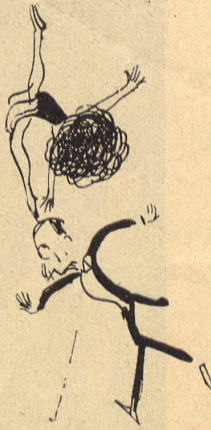
Das Unglück naht