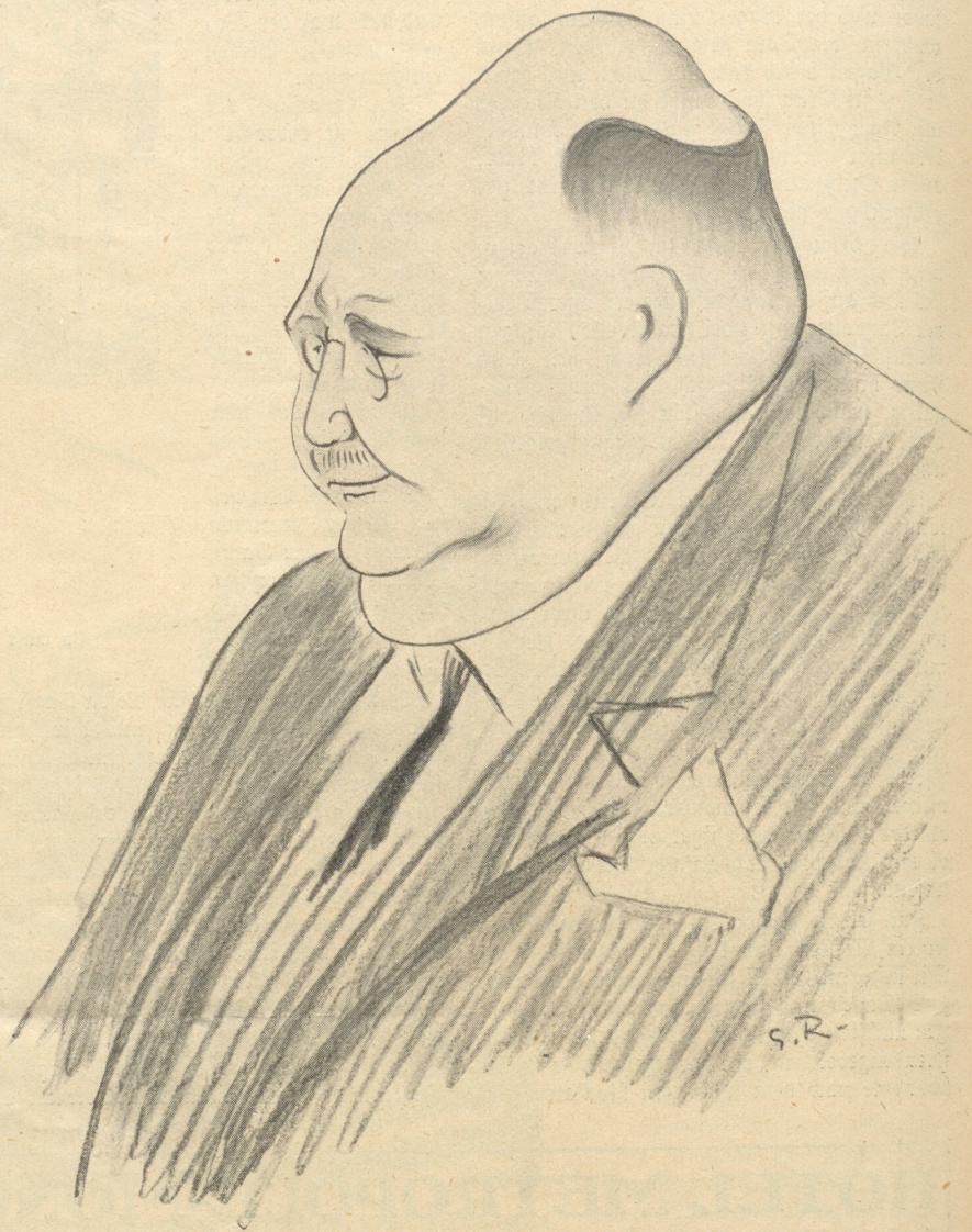
Nationalrat Hans Blaser, Bern.

Begrüßungsfeier fand von 16 Uhr an im großen Restaurant statt. — Hoffentlich be- grüßt sich die Feier immer noch andauernd im großen Restaurant, und wäre es ewig schade, wenn diese Begrüßung je gestört würde.