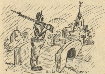
Da han i emol o einisch solle uf ere Brügg stah u luege, daß se d'Finde nid ussprängi.

Wie's de albe geit, we so Dienstkamerade zäme chöme: Si tüe öppe ihri