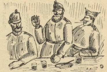
... .är heig am meischte Erfahrig u sy am längste drby gsi.

ere Brügg stah u luege, daß se d'Finde nid ussprängi. Du isch's aber e so gottsjämmerlig cho rägne, un i ha dakt: Nei!