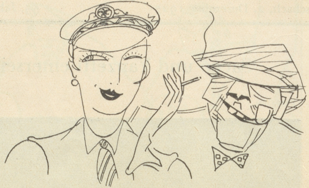
Hallo darlings . . . !