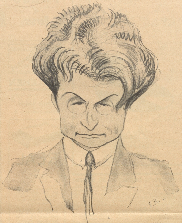
Nationalrat Walter Bringolf, Schaffhausen

bei einigen geringfügigen Angelegenheiten in Anspruch nahm.“