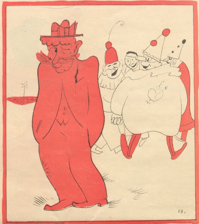
„Daß me sich beweg han verunstalte!“

In diesem Augenblicke zeigte eine anwesende Mannsperson den Mut, sich in die gefährliche Debatte zu stürzen, in der Hoffnung, einige Tropfen beruhigenden Deles in das rauschende Wasser gießen zu können. Aber gleich im Anfang wurde er mit den heftigsten Pfui-Rufen unterbrochen und fast an seinen Hinterbeinen vom Podium gezerrt, weil einige gehört haben wollten, er hätte in seiner Anrede „Geehrte Pfauenversammlung!“ gesagt. Doch mag dies ein Hörfehler gewesen sein. Vielleicht auch ein Sprachfehler, denn, wie mir schien, fiel es jenem Herrn schwer, ein deutliches „n“ zu sprechen. Nicht weniger ungeschickt benahm sich ein anderer Vertreter des überwundenen Geschlechts. Dieser war den Frauen und ihrer Bewegung wohlgesinnt, in der Meinung, Bewegung sei immer gut, bediente sich aber am Schlusse seiner Rede eines