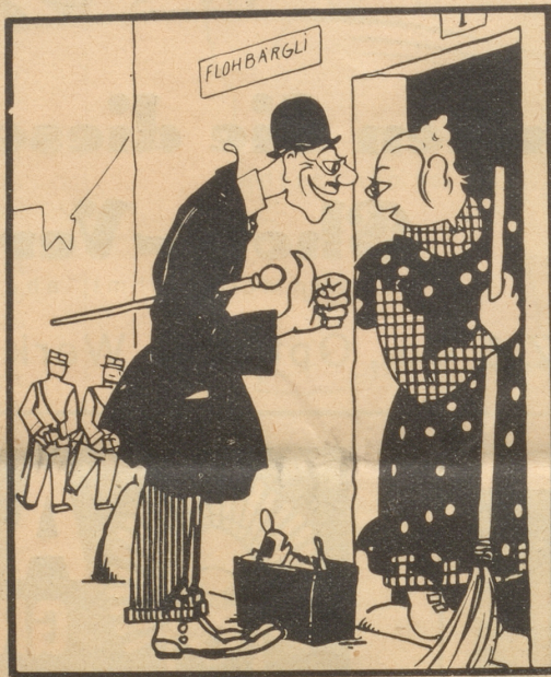
„Sit dann d' Polizei wieder e Hufe Uniformierte igstellt her, geht me viel weniger Lüt uf der Stroß!“

„Susanne“, rief ihre Herrin, „ich glaube, Sie sind eine schlechte, verräterische Person. Jetzt fällt mir ein, daß ich Sie mit jemand über die Gartenhecke sprechen sah.“